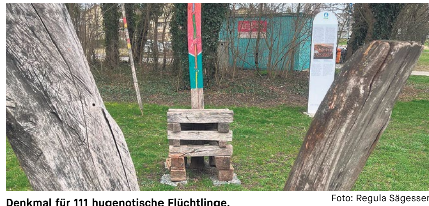
Denkmal für 111 hugenotische Flüchtlinge.

Treffpunkt um 14.30 Uhr Schiffhände Neuenburg Ende ca. 16.30 Uhr in Neuenburg Mitnehmen: Gute Schuhe, wetterfeste Kleidung, Tagesrucksack, Trinkflasche, Picknick Kosten: Fr. 10.— Wanderung Fr. 20.— Stadtführung Billett zum Ausgangsort (Cortailod Temple) und vom Zielort zurück nach Biel individuell lösen. Die Versicherung ist Sache der Teilnehmenden.