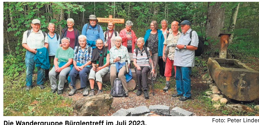
Die Wandergruppe Bürglertreff im Juli 2023.