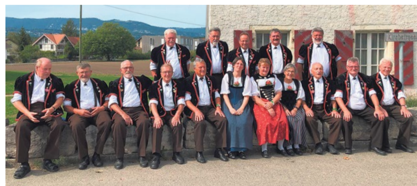
Jodlerklub Blüemlisalp Brügg.