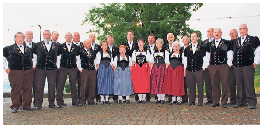
Jodlerklub «Zytröseli», Studen

Alle sind im Namen des veranstaltenden Vereins, des Jodlerklubs «Zytröseli», und der Kirchgemeinde Bürglen herzlich eingeladen.